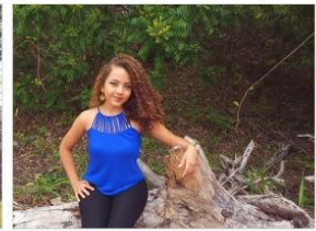
Cód. 067 – Azul