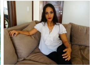
Cód. 072 – Branca

Observe que cada produto possui um código, portanto se você tem interesse em algum produto, anote este código que no menu orçamento você conseguirá solicitar estes produtos ou poderá tirar suas dúvidas com a equipe da Luisa Ribeiro Confeccões.