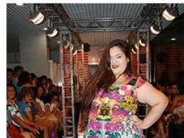
07/12/2016 Desfile feira made in Bahia 2016 Salvador-Bahia