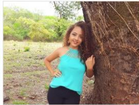
Cód. 067 – Verde