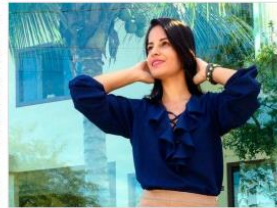
Cód. 072 – Azul