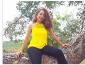
Cód. 067 – Amarelo